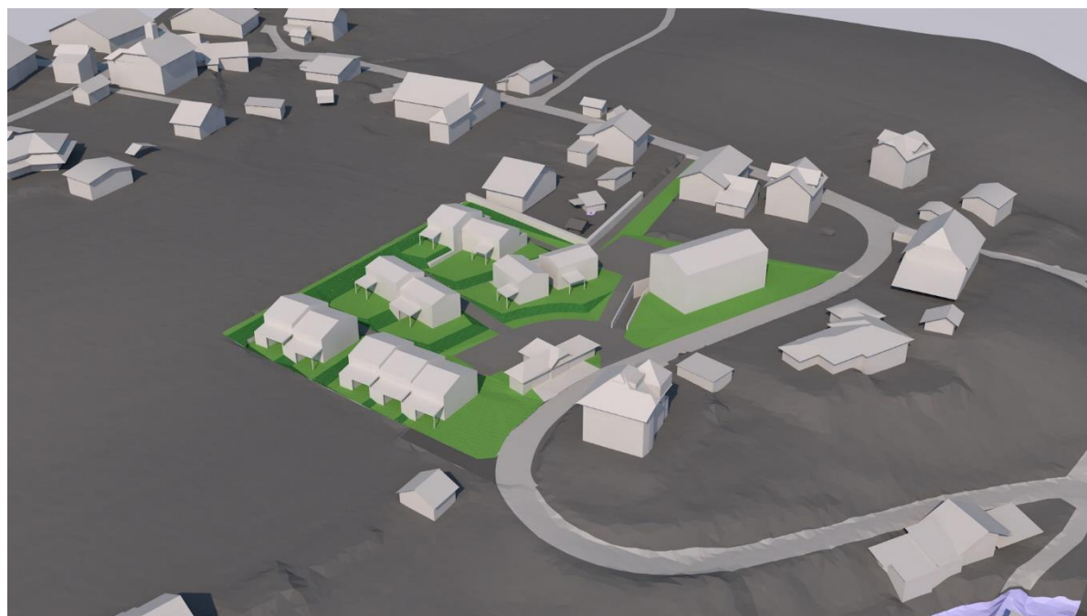
Annexe 2.1 : Avant-projet.